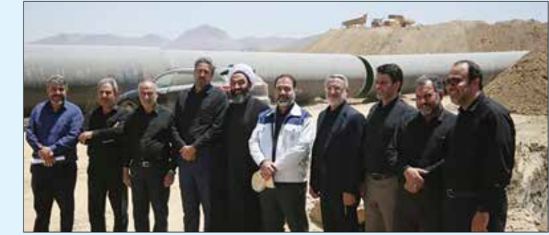
نمایندگان مجلس شورای اسلامی در بازدید از طرح احیای زاینده‌رود

تا نیمه سال آینده، ۲۰۰ میلیون مترمکعب آب شیرین را در دریای عمان به استان اصفهان منتقل کنند.نمایندگان مردم استان در مجلس شورای اسلامی همچنین از نزدیک از پروژه تأمین آب اصفهان از منابع جنوب استان نیز بازدید کردند.این طرح هم‌اکنون در ۱۲ جبهه کاری به‌صورت مستمر در حال اجرا است تا ۲۸۰ میلیون مترمکعب آب را در ابتدای سال ۱۴۰۴ منتقل کنند. به‌این‌ترتیب دو پروژه یادشده به همراه پمپاژ آب از تونل سوم کوهرنگ که از زمستان گذشته آغاز شد و همچنین شروع احداث سد تونل سوم کوهرنگ، احیای زاینده‌رود در نیمه نخست سال ۱۴۰۴ را امکان‌پذیر خواهد کرد.