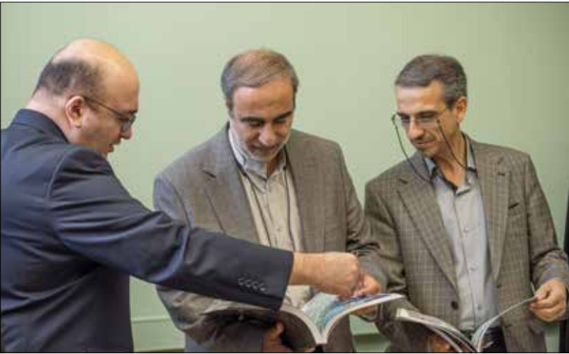
روی خط شورا

مدیرکل فرهنگ و ارشاد اسلامی استان اصفهان از برنامه‌های این اداره کل برای ارتقای زیرساخت‌های فرهنگی خبر داد و گفت: