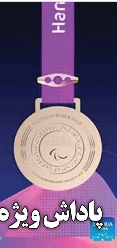
ورزش و جوانان در طول جشنواره اجرا می‌شود.