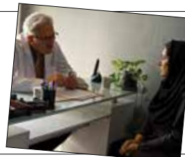
رخشان بنی‌اعتماد در سینما تکرار نمی‌شود