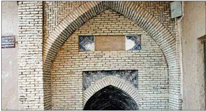
آب‌انبار به شکل اولیه است. او خاطرنشان کرد: آب‌انبار بازار تاریخی نطنز متعلق به دوره قاجاریه است که با

سرپرست اداره میراث فرهنگی شهرستان نطنز گفت: با اختصاص ۶ میلیارد ریال اعتبار آب‌انبار بازار تاریخی باغ شهر نطنز در حال احیا و مرمت است.