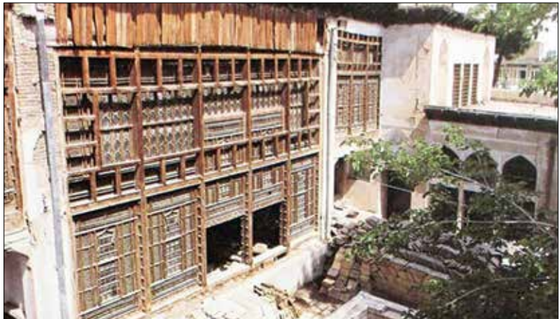
کامرت گردشگری شود. او افزود: مطابق با توافق با شخص نماینده محترم ولی فقیه و امام‌جمعه اصفهان عواید حاصل از